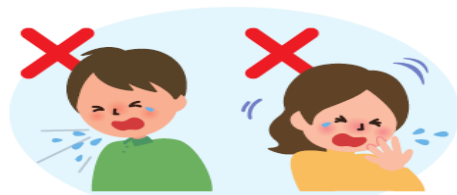
何もせずに 咳やくしゃみをする