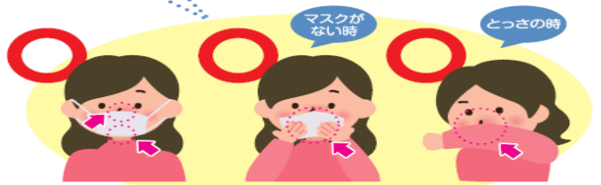
マスクを着用する (口・鼻を覆う)